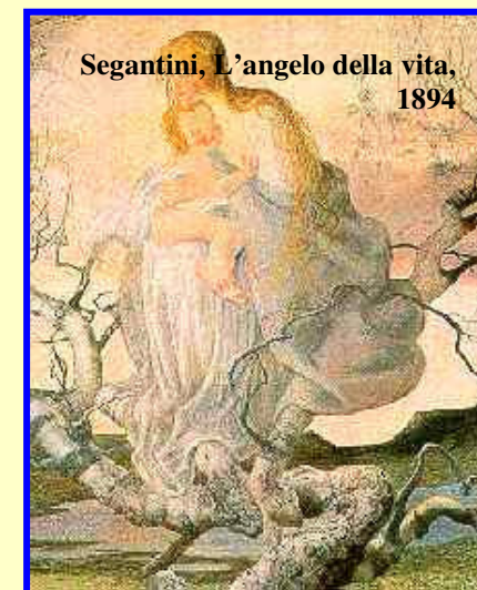
Segantini, L'angelo della vita, 1894

A.FOGAZZARO, Daniele Cortis (1885), Piccolo mondo antico (1895), Piccolo mondo moderno (1900) Il santo (1905). Spiritualismo e rinuncia alla passione. Unione delle anime e adeguamento nella fede ritrovata. Religiosità e sensualità si fronteggiano in forte tensione.