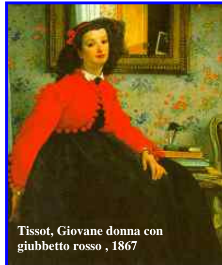
Tissot, Giovane donna con giubbotto rosso, 1867

FLAUBERT, Madame Bovary, 1856 Sogni e suggestioni dell'immaginario romantico su personaggio femminile. La lettura nutre una sensibilità esasperata che non accetta i condizionamenti e la meschinità del matrimonio borghese. L'adulterio ed il suicidio come sconfitta del ruolo femminile.