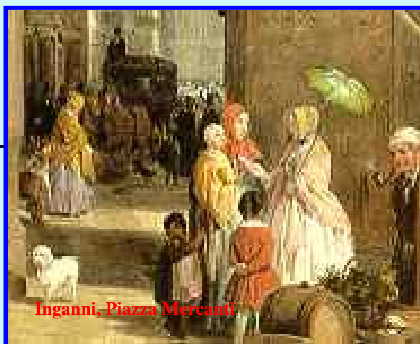
Inganni, Piazza Mercanti

A.MANZONI, I promessi sposi, 1825-27 La famiglia cristiana è esaltata accanto ai valori provvidenziali della storia. La donna è pronta ad affrontare il sacrificio della rinuncia. E' sostenuta dalla fede ed è salvata dall'intervento provvidenziale di Dio, che vuole la sconfitta di arroganti oppressori. Si celebra nella coppia l'ascesa della borghesia operosa e moralizzata.