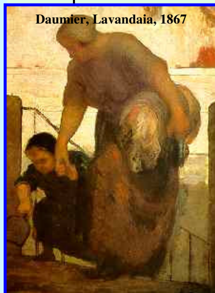
Daumier, Lavandaia, 1867

G.VERGA: Nedda 1874 Problematiche sociali La lupa, 1894 Istintualità L.CAPUANA: Giacinta, 1879 Caso patologico