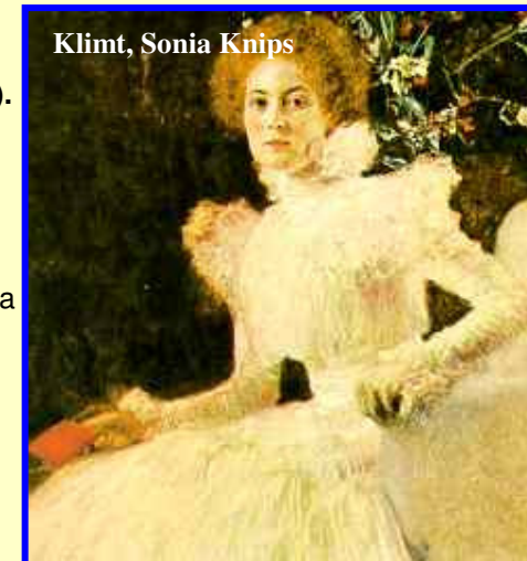
Klimt, Sonia Knips

L.PIRANDELLO, L'esclusa (1901). Il pregiudizio sulla colpa femminile e la impossibile ricerca di identità. La solitudine femminile La famiglia come vuota "forma".