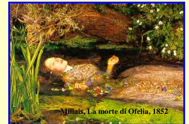
Millais, La morte di Ofelia, 1852

A.FOGAZZARO, Malombra (1881), Leila (1910) Malombra e Leila sono due figure di donne conturbanti che sentono una risonanza panica con la natura e mirano a confondersi profondamente in essa. Malombra è anima peccatrice e fatale seduttrice, che conduce alla