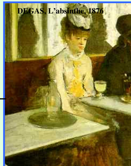
DEGAS, L'absinthe, 1876

ZOLA, L'assommoir, 1877 Il romanzo sperimentale mostra una donna vittima delle tare ereditarie, incapace di lottare contro l'abbruttimento della miseria e preda della degradazione morale. C'è un atto di accusa contro la società borghese che moltiplica le disuguaglianze sociali